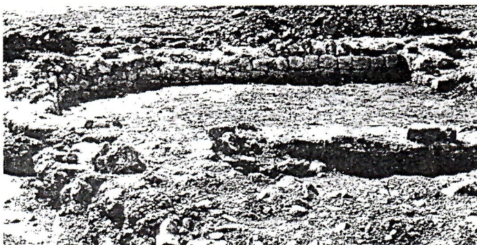
Ostaci ranokršćanske bazilike u Sutini

Die zweite frühchristliche Kirche in Humi-Lišani (Potoci) wurde zufällig beim Aufbau eines Wohnhauses entdeckt. Während der Grabungsarbeiten, gab der Besitzer sehr gut bewahrte Steinteile der architektonischen Plastik aus. Auch diese Kirche wurde in der Nähe einer größeren römischen Siedlung auf Grčine in Potoci entdeckt, die bereits in der Literatur bekannt war. Die Kirche stammt aus dem 4. und 5. Jh.