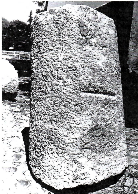
Sl. 2. Ulomak miljokaza s natpisom