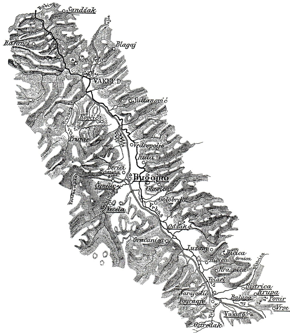
Sl. 1. Uskoplje 1897. g. Fig. 1. Uskoplje on 1897.