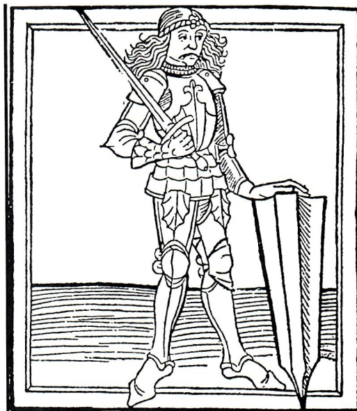
János Hunyadi (Sibinjanin Janko), drvorez (Klaić, Povijest Hrvata)

Ugarskoj i Hrvatskoj. 27 Imao je starijega sina Ladislava Hunyadija, koji je 1453. postao hrvatsko-dalmatinskim banom. Njegov mladi sin Matijaš, poznat po nadimku Korvin zbog gavrana u grbu, 28 izabran je 1458. za ugarsko-hrvatskoga kralja. 29 U jednoj narodnoj pjesmi Janko Sibinjanin, po erdeljskom gradu Sibinju (mađarski Nagy Szeben, rumunjski Sibiu), nazvan je "Madžar Janko od Erdelj-Krajine". 30 Dio pjesama o njemu ima opće motive narodne prilagodbe. Vojvoda Janko bio je nazvan i Matija Ivanić, vođa pučke bune na Hvaru. To znači da su se pjesme o Janku Sibinjaninu pjevale na Hvaru i