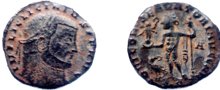
Sl. 3. Lice i naličje novca cara Licijana (307.-323.).

Novac je bakreni, dobro uščuvan, vrsta follis , kovan u Sisku između 313.-315. god.; težina 2 g; promjer 21 i 22 mm.