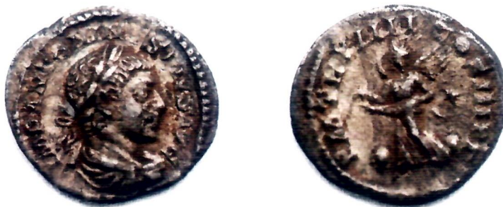
Sl. 2. Lice i naličje novca cara Elagabala (218.-222.).

Novac je od srebra, vrsta denar , kovan u rimskoj kovnici 221. god.; težina 2,29 g; promjer 18 i 20 mm.