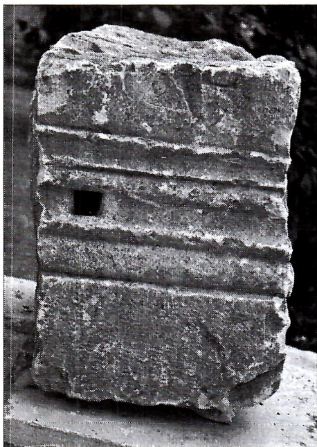
Sl. 2. Žrtvenik iz M. Vrata, Ljubuški.

2. Drugi ulomak (Sl. 2) slične kamene strukture, pravokutna je oblika s približnim dimenzijama v - 25 cm, d - 22 cm i š - 18 cm. Između gornjega dijela, očito natpisna polja, i donjega dijela, vjerojatno postolja, nalazi se trostruko profilirana greda, čiji su gornji i donji profili široki 2,5 cm, a srednji 5 cm. Ista profilacija vidljiva je i sa zadnje strane ulomka. U sredini profilacije vidi se četvrtasta rupa, što govori da je spomenik bio naknadno korišten. U natpisnom polju vidljivi su u zadnjem redu tragovi dva slova. Prvo ima samo pri dnu urezanu okomitu crtu sa serifom, a od drugoga vidi se dio okomite crte i haste okrenute udesno. Vjerojatno je u pitanju obredna kratica, možda P L, odnosno P(osuit) L(ibens)? Spomenik se nalazi u posjedu V. Nuića.