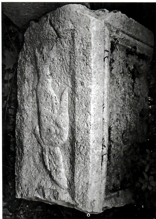
Sl. 1. Cipus iz Konjica (Foto R. Dodig).

VALNEA SANTA MARIA SCRINARI 1972., Museo archeologico di Aquileia: Catalogo delle sculture Romane , Ministero della pubblica istruzione, Roma. ŠARIĆ 1975., Japodske urne u Lici , VAMZ, Zagreb, IX, 23-32. TRUHELKA 1931., Starokršćanska arheologija , Hrvatsko književno društvo sv. Jeronima, Zagreb. VIKIĆ - BELANČIĆ 1971., Antičke svjetiljke u Arheološkom muzeju u Zagrebu , I, VAMZ, V, Zagreb, 97-102. WERNES 2003., The Continuum Encyclopedia of Animal Symbolism in Art , Continuum International Publishing Group, New York.