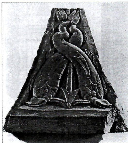
Sl. 4. Piramidalna ara iz Akvileje (Scrinari, 1972., no. 399).