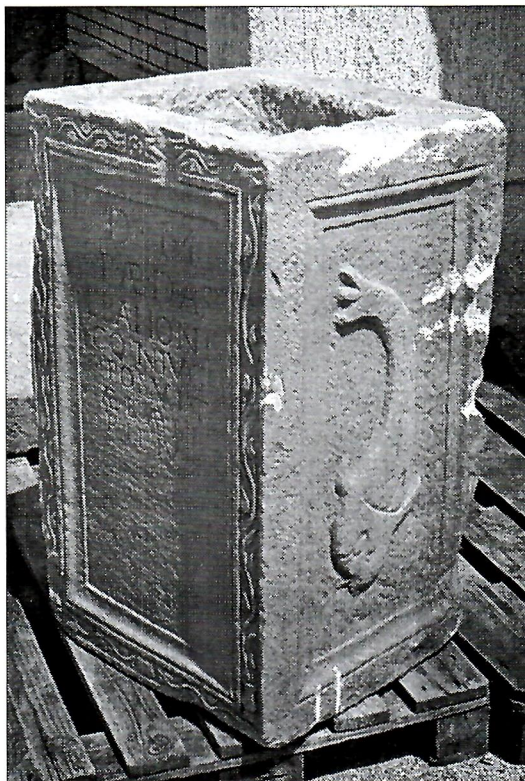
Sl. 3. Duvanjski cippus (Dodig, 2005., sl. 1)