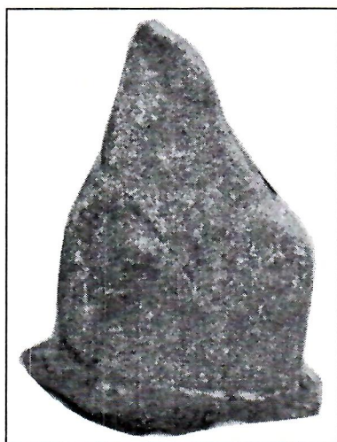
Slika 1. Glinena cijev

U neposrednoj blizini (oko 120 m) Jozo Grabovac (Ilijin) pronašao je glinene cijevi okomito postavljene u dubinu. Jedan je komad uništio kopajući, a drugi je očuvan izvadio iz zemlje. On kaže da je dolje u zemlji ostalo još takvih cijevi.