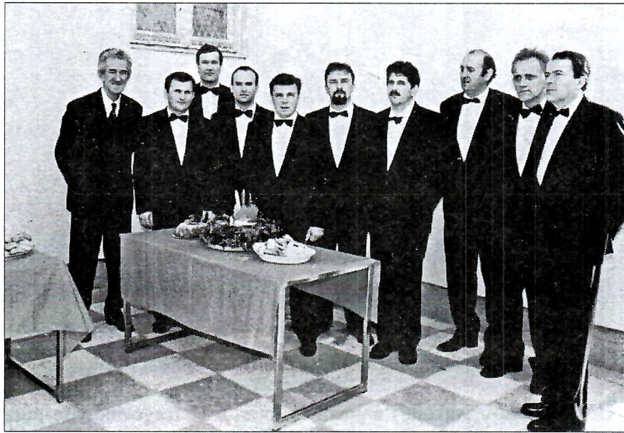
Sl. 5. Klapa Hrvoje na proslavi Božića.

Skupština 1990. god. bira novi Odbor koji želi obnoviti veliki broj sekcija. Uspijevaju vrlo kratko da to učine zbog nedostatka novca, prostora i zaokupljenosti članova osobnim problemima. Samo klapa nastavlja živu aktivnost, izdaje CD Pjesmo moja hercegovačka . Godišnje ima od 20 do 100 nastupa.