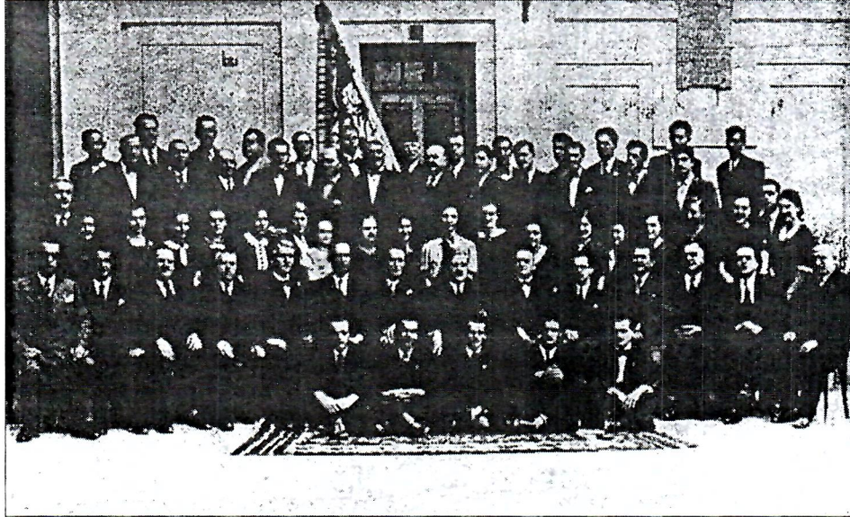
Sl. 3. Zbor HPD Mrvoje prigodom proslave 50. godišnjice, 1939. god.

je snagu, požrtvovnost osnivača i promicatelja Mrvoja čijom zaslugom je izrastao u respektabilno društvo sa visokim idealima. Odajući zahvalnost precima dr. Smoljan ističe: "Domovinska Ljubav, čast i ponos hrvatskog naroda jedini su principi na kojima vodimo naše Mrvoje ." Ta trodnevna svečanost održana je u sjeni nastupajućeg rata koji je donio zamiranje cjelokupnog rada društva. Poslije rata 1945. god. obnovljen je rad nacionalnih društava pod novim imenima. Mrvoje djeluje s Napretkom skoro do 1949. god. kada proglasom prestaje rad Prosvjete , Napretka i Preporoda .