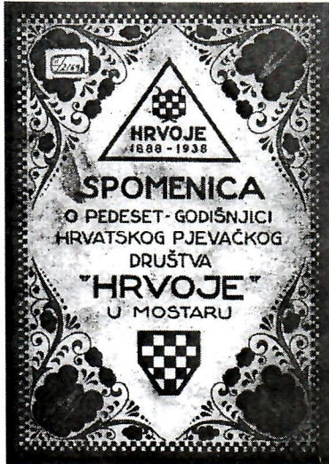
Sl. 2. Spomenica.

Pripremala se proslava 100. obljetnice hrvatske himne. Trebalo je to biti pravo narodno veselje, ali poslije političkoga zbora održanog 12. srpnja 1937. biva odgođena a kasnije održana bila je veoma skromna.