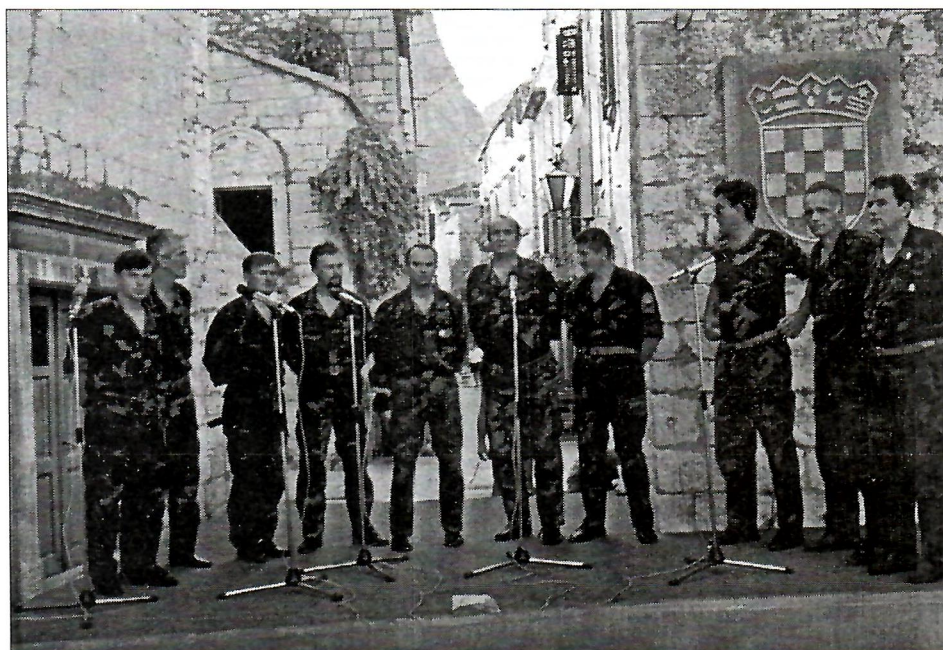
Sl. 4. Klapa Hrvoje na Omiškom festivalu.

Sudjeluju na Splitskom festivalu na Večeri domoljubne pjesme, a na Omiškom festivalu 1992. god. dobiva prvu nagradu za najboljeg debitanta.