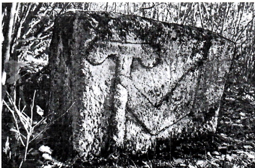
Sl. 2. Stećak br. 14.