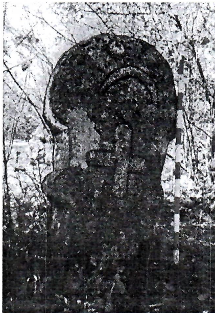
Sl. 4. Stećak br. 23.