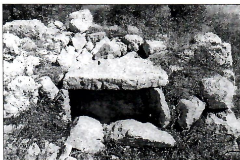
Sl. 3. Lokalitet Golubinac.

Velika grobnica na Krtinama u Veljoj Međi nalazi se na padini brda iznad sela. Ulazna kamena ploča je nestala. Uz desni zid je kameni ležaj oko 0,50 m ozidan iznad zemlje. Nasuprot ulazu ozidana je kamena klupa, a s lijeve strane je kvadratična slijepa niša.