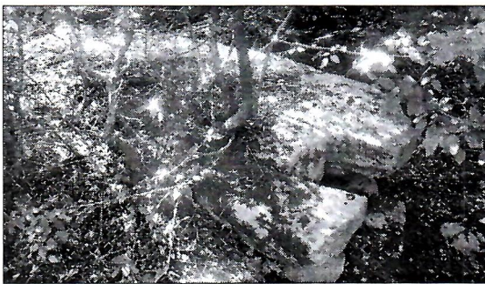
Sl. 5. Lokalitet Gizdave u Hodovu.

Na lokalitetu Gizdave u Hodovu kod Stoca nalaze se ostaci neke starije građevine, čiji je materijal sekundarno iskorišten na neregistriranoj nekropoli stećaka na kojoj se izdvaja nalaz kamene ploče s reljefom figure u adorantskom položaju. 6 Lokalitet je veoma zarastao šumom i makijom.