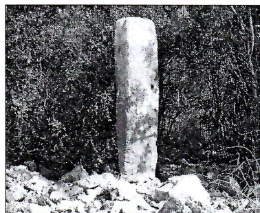
Sl. 1 i 2. Lokalitet Previš kod Hutova.