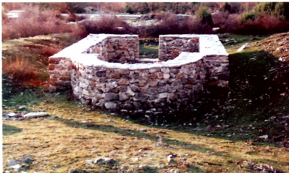
Sl. 2. Konzervirana crkva u Tepčićima.

Nadamo se da će se ova inicijativa uspješno realizirati.