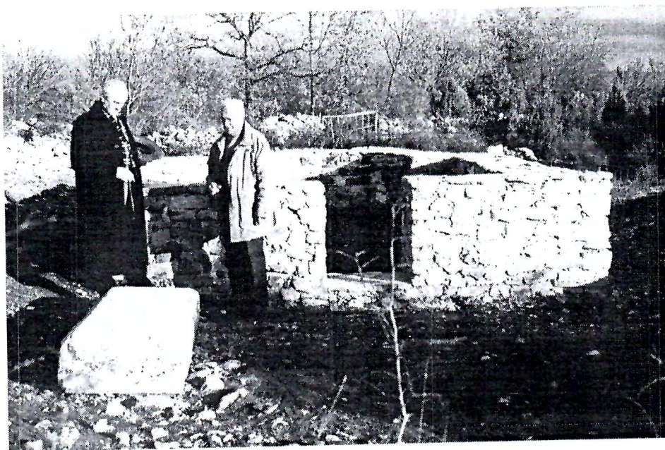
Sl. 4. Konzervirana crkva u Tepčićima.