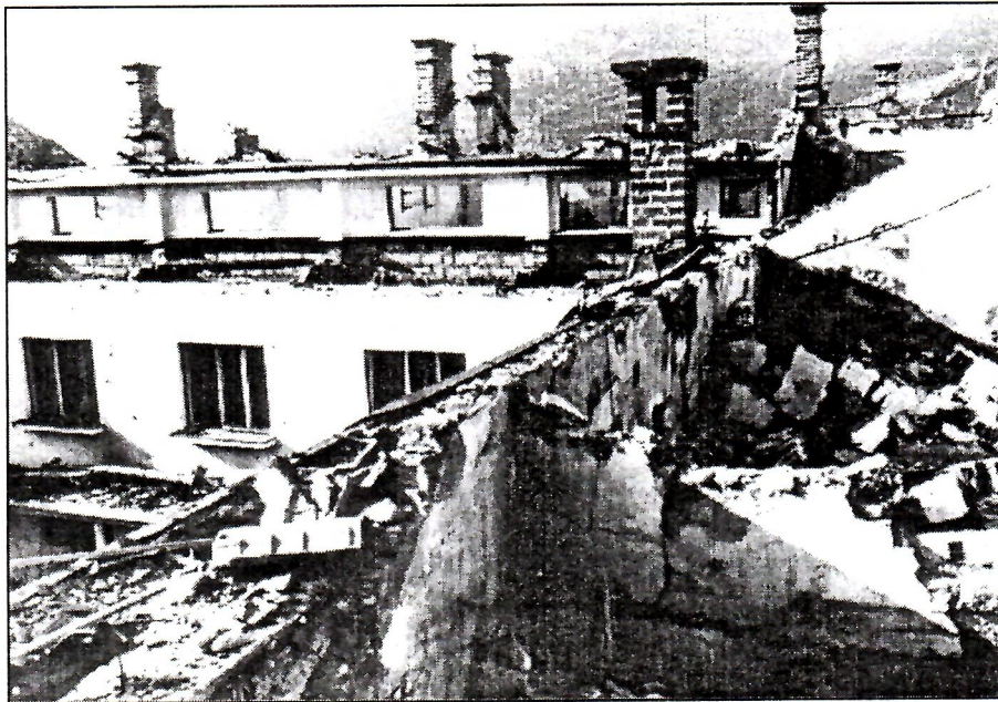
POTOCI, Samostan časnih sestara franjevki