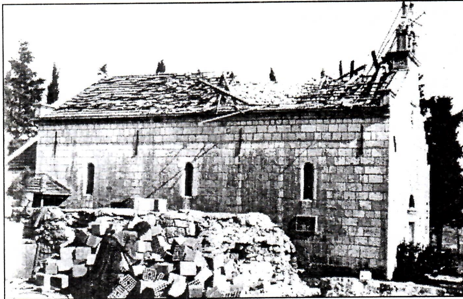
RAVNO, Crkva Marijina rodenja