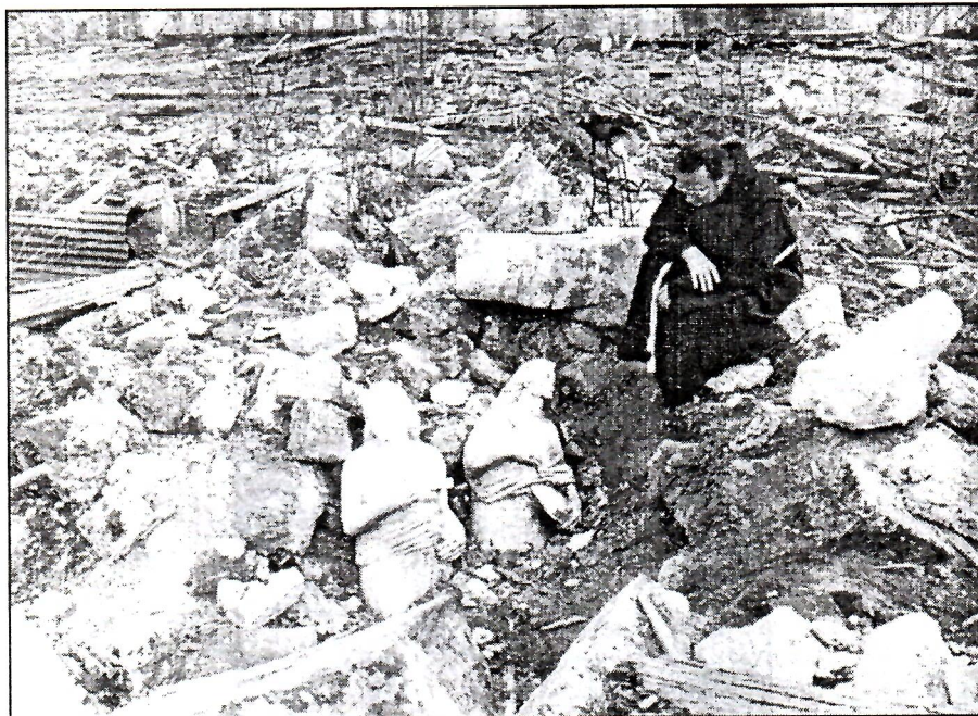
JAJCE-PODMILAČJE, Crkva sv. Ive