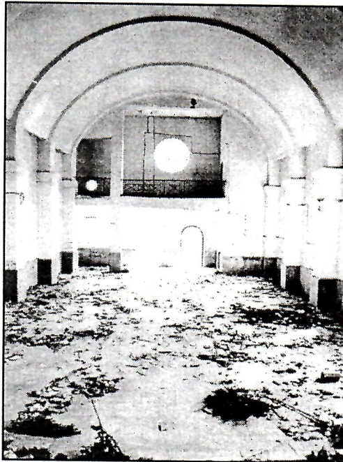
Crkva Presvetog srca Isusova u Konjicu (Obri)