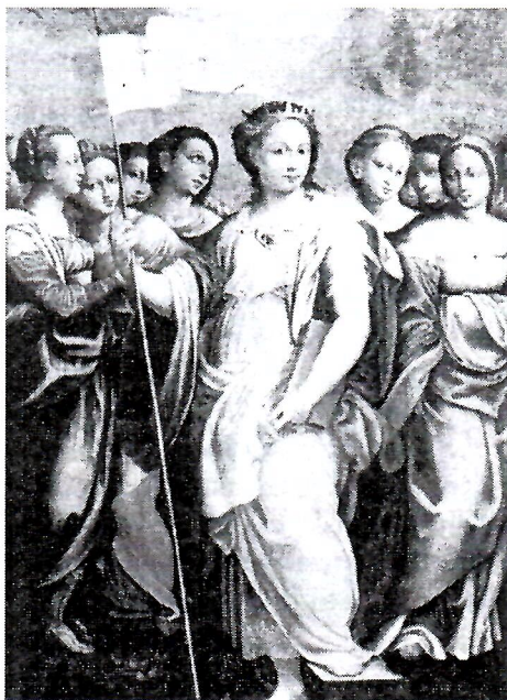
"Zbor djevice", Paolo Severius, XVIII. st., Franjevački samostan Mostar

Najbolji pregled jednog dijela pokretnog kulturno-povijesnog i umjetničkog blaga imali smo prigodu vidjeti na reprezentativnoj izložbi održanoj u Sarajevu 1988. i Zagrebu 1989. godine. Proučavajući našu kulturno-povijesnu baštinu, koja je pretežno zaslugom i velikom brigom franjevaca Bosne i Hercegovine sačuvana do našeg vremena, rasvijetljeno je dugo