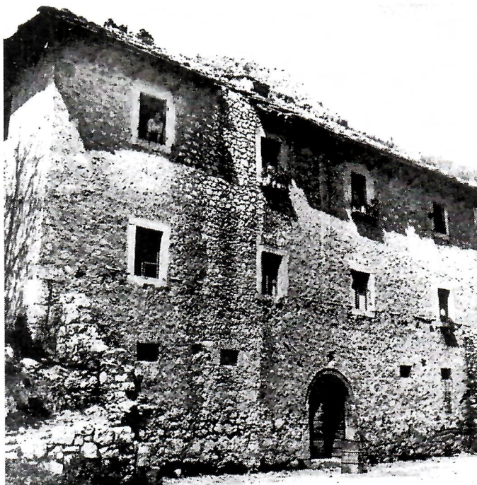
Stara mostarska biskupija

pomoć službe zaštite, poduzme odgovarajuće mjere kako bi se konačno izvršila njezina zaštita i obnova, jer je, u protivnom, osuđena na potpuno uništenje. Neposredno prije otvorenja izložbe fotografija i dokumenata o staroj biskupiji u Mostaru u organizaciji Matice hrvatske izvršeno je i