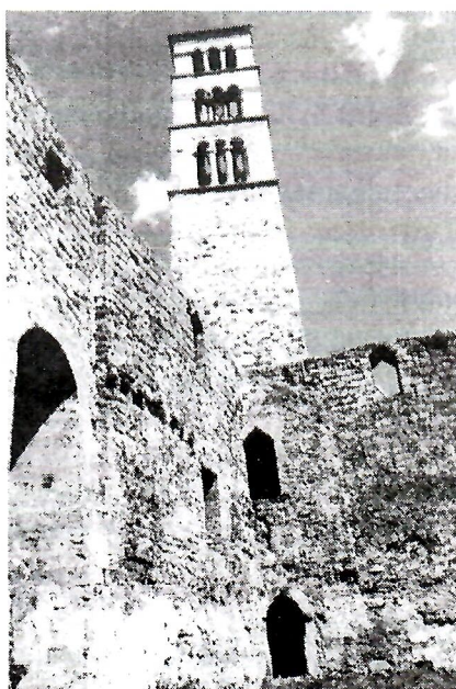
Toranj sv. Luke, dozidan uz crkvu Sv. Marije u kojoj se 1461. okrunio Stjepan Tomašević, posljednji bosanski kralj

Pored ove izložbe održan je i okrugli stol s temom zaštite i obnove kulturno-povijesne i prirodne baštine