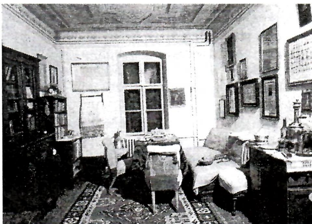
Radna soba fra Grge Martića u Franjevačkom samostanu Kreševu

Proučavanje franjevačke knjižne i arhivske baštine pridonosi rasvjetljivanju kulturne epohe jednog povijesnog trajanja i duhovne sredine iz koje su potekle kao spomenici naše prošlosti. Pred nama je da štitimo ovu kulturnu baštinu i da je neoštećenu predamo našim nasljednicima, a pred istraživačima povijesti hrvatskog naroda u Bosni i Hercegovini stoje složeni zadaci da se znanstveno istražuje, prikuplja i objavljuje knjižna građa i izvori koji su u prošlosti bili čuvari naše pisane riječi. Pored niza eksponata značajnijih knjiga i arhivske građe koja je bila izložena u velikoj samostanskoj dvorani u Kreševu, ovom prigodom izloženo je i