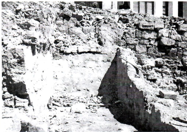
Sl. 3. Prostorija s podnicom iznad voltastog otvora

Na slici 2. vidi se debela podnica, a ispod nje se primjećuje svodasti otvor, što je vjerojatno vezano za sustav i način funkcioniranja kupatila. Ispod, na desnoj poziciji ovog dijela konstrukcije kupatila, zapaža se četvrtasti, vjerojatno zatvoreni kanal, koji je s obzirom na konstruktivnost ovog dijela objekta, pripadao ipak kupatilu.