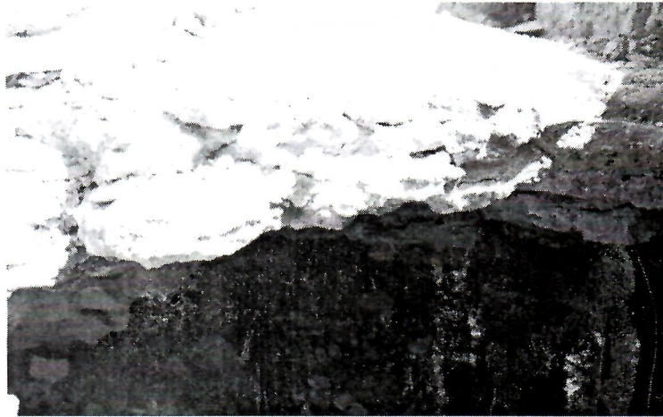
Sl. 2. Detalj podnice sa svodastim otvorom

dojam da međusobna blizina spomenutih širokih zidova, izgleda, krije u sebi izvjesnu kronološku različitost među njima. To bi mogla utvrditi arheološka sustavna istraživanja ovih prostora s arhitekturom. Trebalo bi istražiti kako bi se eventualno mogla utvrditi postavljena hipoteza o mogućim tragovima iz rimskog doba.