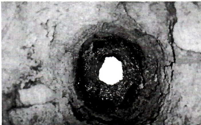
Sl. 6. Tubulus u konstrukciji zida

Ovdje bismo prisutnom fotografijom (sl. 5.) željeli pokazati otvor koji formira tubulus iz doba turske provenijencije, ali ugrađen u vodoravnom položaju u zidu, pa nam je s obzirom na njegov takav položaj vrlo teško odrediti pravu funkciju, naime, koliko je korišten za toplu ili hladnu vodu, odnosno topli zrak.