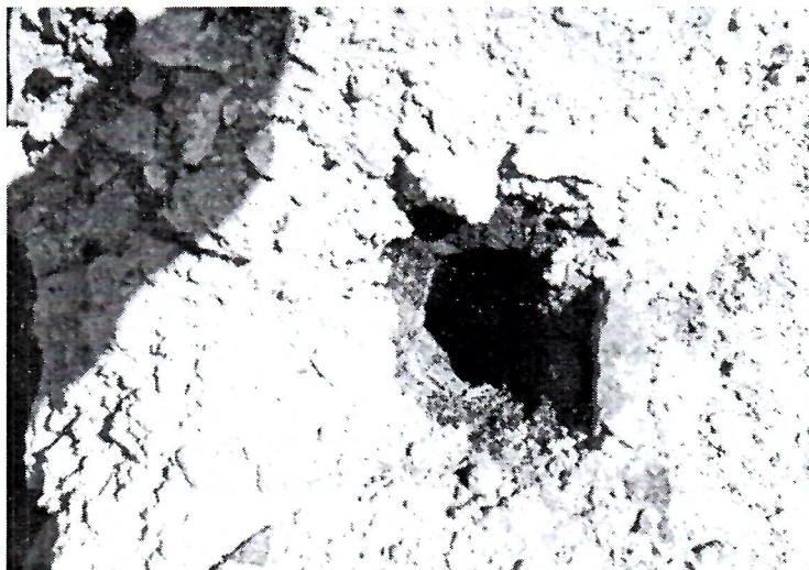
Sl. 8. Još jedan otvor u funkciji turskog kupatila

Otvor (sl. 7.) je u arhitektonskom spletu kupatila jedan od onih otvora koji je služio dovodu ili odvodu tople ili hladne vode. U zidu je ugrađen vodoravno bez tubulusa, a tragovi crvene boje na žbuci oko otvora govore da je ipak više služio dovodu tople nego vruće vode, nalazeći se blizu ložišta-perurmijuma.