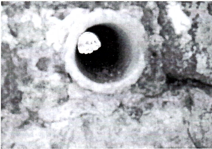
Sl. 5. Tubulus ugrađen vodoravno u zid

Ovom fotografijom želimo pokazati nadvratnik otvora na kojem imamo fragmentarnu paralelu s nadvratnikom uklesano žljebasto udubljenje (sl. 4.). Ovako postavljena kamena ploča-nadvratnik, predstavlja kvadratični oblik otvora u sustavu.