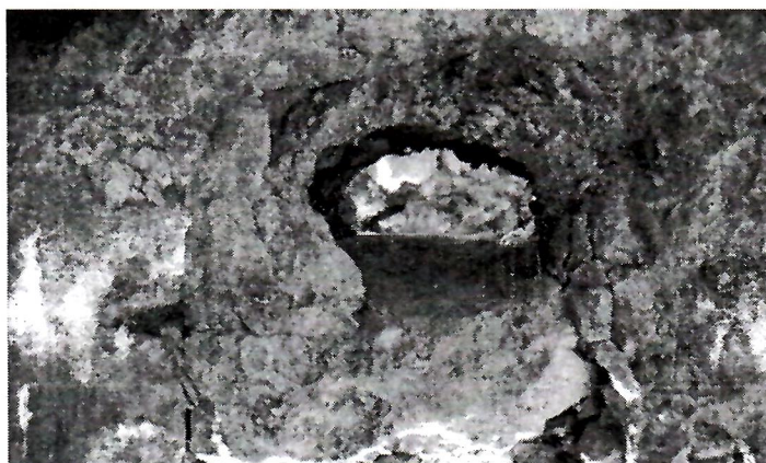
Sl. 7. Otvor ugrađen vodoravno u zidu bez tubulusa

Tubulus je (sl. 6.) u konstrukciji zida kupatila ovalnog oblika, za razliku od rimskih, koji mogu imati kvadratičnu i ovalnu formu. U zidu kupatila ugrađen je okomito s veoma vidljivim od dima crnim tragovima unutar njega, služio je očito u službi provođenja toplog zraka, koji je zagrijavao gornje prostorije kupatila.