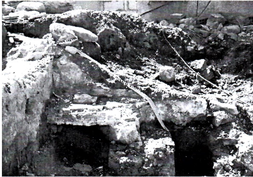
Sl. 1. Detalj podnice turskog kupatila

vezi s nalazom kupatila iz turskog doba, osvrnut ćemo se na nalazišta iz razdoblja antike i kasne antike, jer nam ona, s obzirom na pretpostavku postojanja starokršćanske crkve iz konca 4. i početka 5. stoljeća, mogu najbolje približiti njegovu lokaciju. U tom pogledu, posebnu pomoć bi nam mogao pružiti i nalaz kupatila iz 16. stoljeća, koji je upravo nađen na prostoru grada Jajca i na kojem je otkriveno više nalazišta iz antičkog i kasnoantičkog doba. Inače, poznata je pojava da se kulturni i drugi islamski objekti arhitekture upravo znaju podizati na kršćanskim, u našem primjeru, vjerojatno supstrukcijama starokršćanske crkve (bazilike) u Jajcu, čiju lokaciju tražimo.