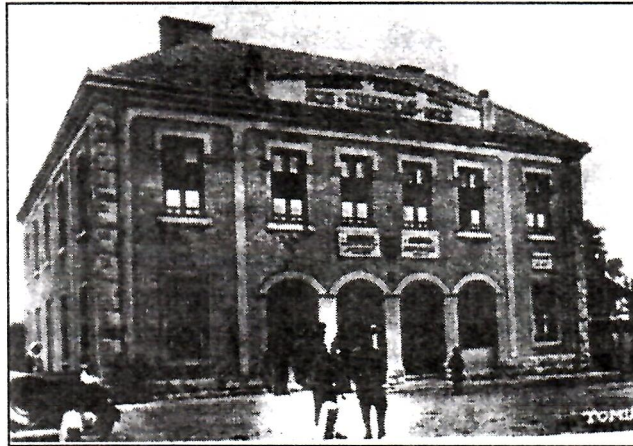
Zgrada Hrvatskog spomen-doma u Tomislav Gradu, središte društvenog i kulturnog života duvanjskih Hrvata od 1928. godine do njegova rušenja u Drugom svjetskom ratu