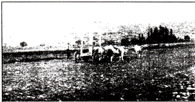
Tradicionalna duvanjska kola. U pozadini Vran planina (Foto: M. Knežević, 1940.)