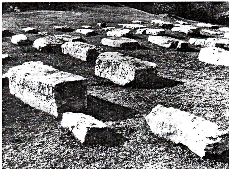
Stećci na novoj lokaciji nizvodno od brane HE Salakovac

Nach dem Aufbau des Wasserwerks Salakovac wurde die Nekropole Vituša geschützt, von wo Grabsteine auf eine andere Stelle versetzt wurden.