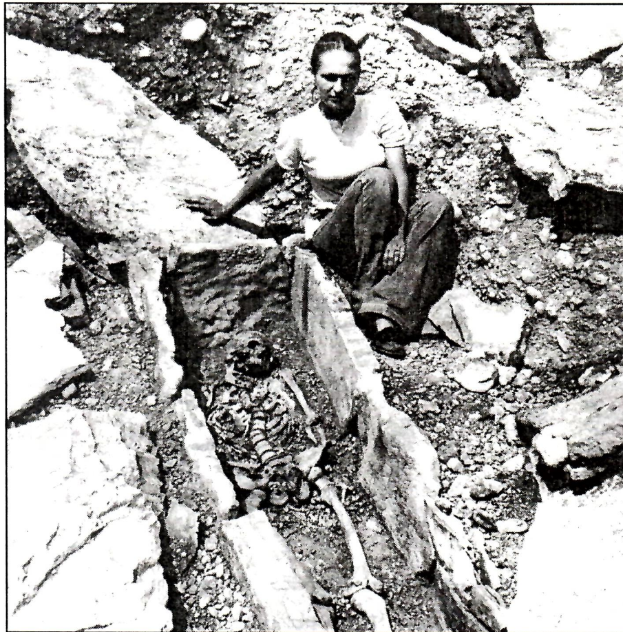
Arheološko istraživanje nekropole Vituša