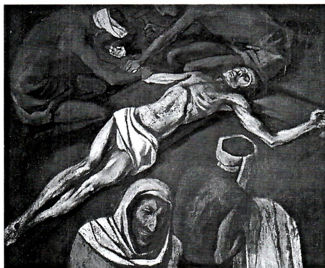
Sl. 10. Biffel, Razapinjanje.

Počeci Galerije, kao i počeci Muzeja, imaju također svojevrsnu prehistoriju. Već više godina prije Domovinskoga rata grad i župa dobili su dvije vrlo vrijedne kolekcije slika poznatih umjetnika kao donaciju dr. sc. don Vijeke Bože Jaraka. Dr. Jarak je i nakon Domovinskoga rata darovao župi Neum vrlo vrijednu kolekciju umjetnina: Križni put. Specifična mu vrijednost leži u tomu što je svaka postaja ne samo djelo drugoga umjetnika, nego i to što su izrađene i u raznolikoj tehnici. Ova kolekcija je smještena u samu župnu crkvu Gospe od Zdravlja, te služi kao Križni put za pobožnost (kult).