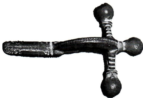
Sl. 3. Rimska fibula.

O komunikacijama iz prethistorije zorno govore nizovi gomila pokraj kojih su prolazili putovi ili između njih. Područje je izrazito bogato i prethistorijskim gradinama pa i vangradinskim naseljima. 1 U rimsko doba, uz onu u znanosti odavno prihvaćenu komunikaciju iz Neretve preko neumskoga područja kroz Dubrovačko primorje, treba svakako argumentirano pretpostaviti i onu u pravcu jug - sjever, od mora prema unutrašnjosti. To dokazuju brojni nalazi iz rimskoga doba na pravcu Neum - Hutovo. Mnoga naselja na užem području Neuma (Neum, Radež, Zaradež, Ilijino Polje, Vranjevo Selo, Neljetovlje u susjednoj Dalmaciji) bila su svakako povezana s onima koja su nastala uz prethistorijsku komunikaciju počevši od Neuma preko Moševića, Graca, Broćanca, Prapatnice i Hutova i dalje na sjever. 2