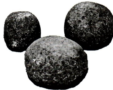
Sl. 2. Ručni mlinovi.