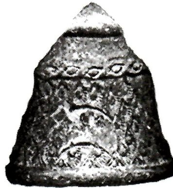
Sl. 6. Dio ukrašene posude, Gradac.

Nalazi s neumskoga područja pali su već odavno u oči mnogim istraživačima. 4 Obilno su ih koristili i trgovci koji su ih nosili u Zemaljski muzej u Sarajevo, gdje se čuvaju. 5 Dio ostataka iz prošlosti ovoga kraja