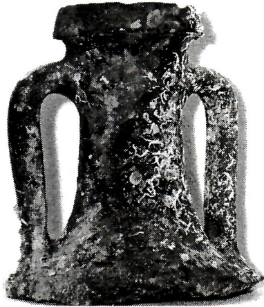
Sl. 5. Dio jedne od nekoliko neumskih amfora.

U doba Turaka neumsko područje stagnira, važnim postaje tek u vrijeme velikih ratova: Dugoga (1593.-1606.), Kandijskoga (1645.-1669.), Morejskoga (1683./4.-1699.) i tzv. Maloga rata (1714.-1718.) kada područje dobiva na strateškoj važnosti u mletačko-turskim sukobima. Kulišića kula u Neumu, te izgradnja i dogradnje na starom gradu Hutovu spomenici su na to nemirno razdoblje turskoga i mletačkoga gospodstva.