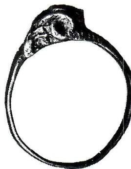
Sl. 4. Antički prsten s likom Uroborora.