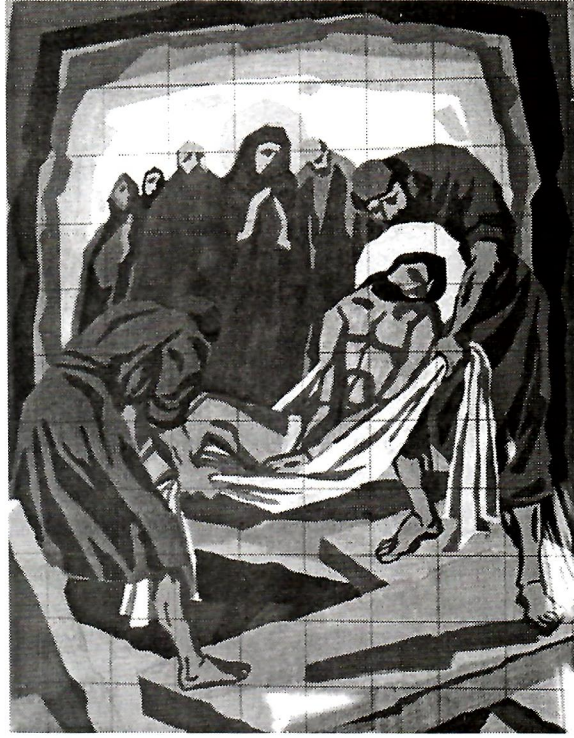
Sl. 12. Đ. Seder, XIV. postaja, Isusa polažu u grob.

Spomenutim donacijama nadošla je znatno veća kolekcija slika nastala radom Umjetničke kolonije u Neum tijekom proteklih deset godina. 7 Za pokretanje kolonije, uz općinske vlasti, posebno su zaslužni prof. Stanko Špoljarić, don Blaž Ivanda i slikar Srećko Kriste. Kolonija se redovito održava neposredno prije početka ljetne sezone u hotelu Sunce. Djela nastala tijekom proteklih deset godina brojna su, jedan dio je u vlasništvu Muzeja i Galerije Neum , a drugi, brojem znatno veći, nalazi se po zidovima neumskih hotela, općinskih zgrada, ugostiteljskih i drugih gospodarstvenih prostorija te kod privatnih osoba, osobito onih koji su podupirali donacijama održavanje kolonija ili su do umjetnina došli aukcijama koje su u nekoliko navrata organizirane da bi se došlo do sredstava za održavanje kolonije.