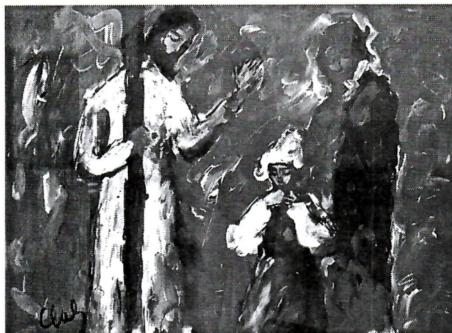
Sl. 9. Lj. Lach, Isus tješi žene.