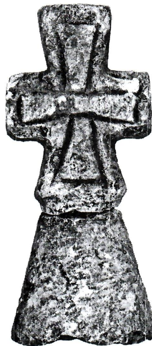
Sl. 7. Starohrvatski križ, nekropola Vranjevo Selo.

U muzejskim vitrinama našli su mjesto i mnogi sitni ostaci neprocjenjive vrijednosti iz raznih razdoblja. Uz vrijedne primjerke novca osobitu pažnju privlači prsten s likom Urobora iz Vranjeva Sela. Isto tako fibule, ukrasi i dr. s gradine Malokrkn u Gracu. Ostaci brojnih amfora, više ili manje