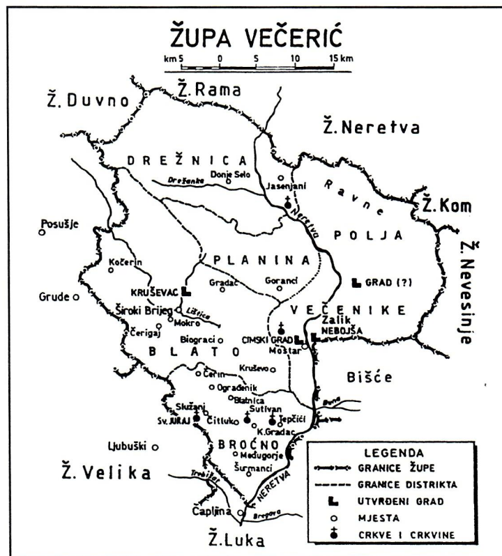
Sl. 2. Zemljovid župe Večenike (Večerić). (Preuzeto iz knjige P. Anđelić, M. Sivrić, T. Anđelić: Srednjovjekovne Humske župe, Mostar 1999., str. 186)

Na zahumskom je području pronađeno i više grobova za koje je utvrđeno da pripadaju kasnom srednjem vijeku, dok je već dugo vremena poznato postojanje groblja sa stećcima na Smrčenjacima, također iz tih godina. 29