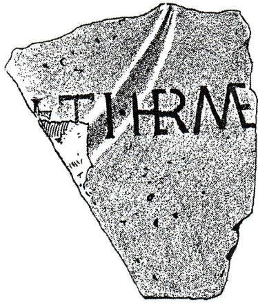
Sl. 1. Pečat iz Zličine, Radišiči (Patsch).