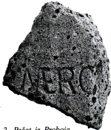
Sl. 3. Pečat iz Proboja.