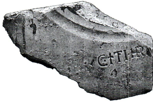
Sl. 4. Pečat iz Studenaca.