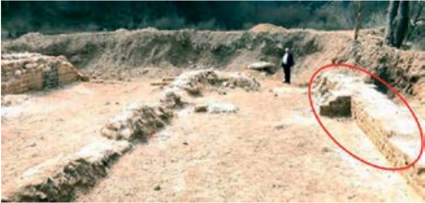
Sl. 12. Segment južnog zida južne prostorije Fig. 12. Part of the south wall of the south room