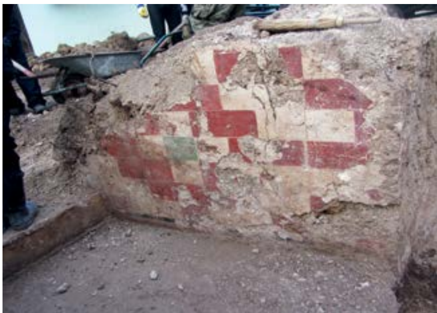
Sl. 7. Freska na istočnoj strani ulaza iz sjeverne u srednju prostoriju Fig. 7. Frescoes on the east side of the entrance from the north to the middle room