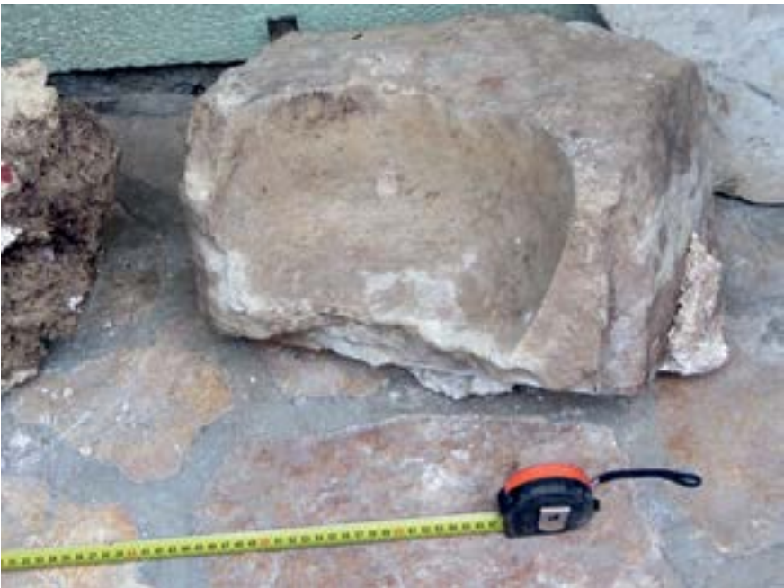
Sl. 5. Ulomak kamene zdjele Fig. 5. Fragment of a stone jar