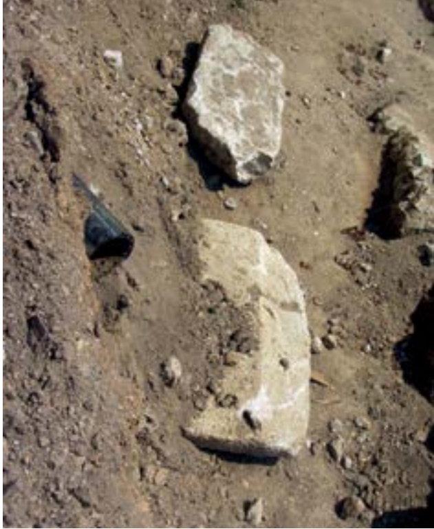
Sl. 15. Dijelovi srednjovjekovnih nadgrobnika Fig. 15. Parts of the medieval tombstones