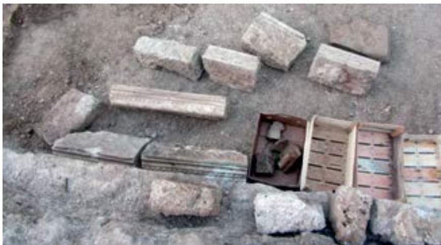
Sl. 2. Ulomci dovratnikâ i nadvratnikâ iz srednje prostorije Fig. 2. Fragments of door-posts and lintels from the central room