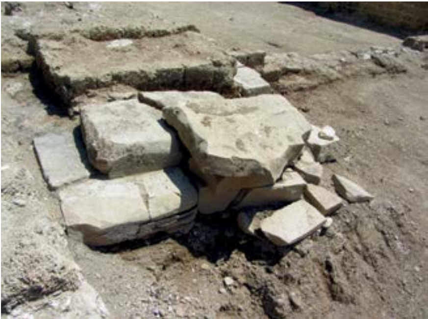
Sl. 13. Grobnica pokraj zida koji dijeli srednju od južne prostorije Fig. 13. Tomb along the wall that separates the middle and south room