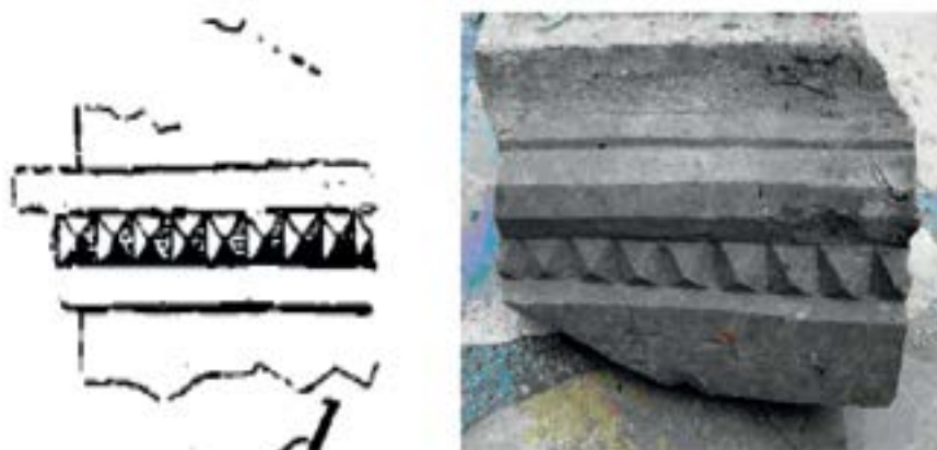
Sl. 20. Ornament sa zvonika sv. Luke u Jajcu (lijevo) i s Crkvina u Veseloj (desno) Fig. 20. Ornament from the bell tower of the St. Luke church in Jajce (left) and from the Crkvine location in Vesela (right)

freskama ukrašavao Dragić Medošević, rodom iz Bosanskog Grahova, koji je od 1453. do 1457. godine slikarstvo učio u radionici splitskog slikara Dujma. 68 Bez sumnje je devastiran tijekom osmanlijskog osvajanja Uskoplja u proljeće 1463., odnosno njihova protjerivanja iz Bosne u ljeto i jesen iste godine. U tim su se okolnostima mogli zbiti i ukopi unutar i oko ovoga objekta. Nakon izгона Osmanlija iz Bosne u ljeto i jesen 1463. godine kraljevski su posjedi dospjeli u ruke ugarsko-hrvatskog kralja Matijaša Korvina (1458.-1490.). Zbog zasluga u protjerivanju Osmanlija Matijaš Korvin je 6. prosinca 1463. Vladislavu Vukčiću Kosači (oko 1427.-1490.), sinu mu Balši i njihovim nasljednicima, dodijelio i posjede bosanskog kralja Veselu Strazu sa župom Uskoplje. 69 Kako nisu imali drugog boravišta u ovoj župi, očito je i preuređivan za Kosače koji su iz njega upravljali ovom župom i ubirali prihode od karavanske trgovine. U prilog tomu govori i motiv crveno-bijelih pravokutnika s pokojim plavo-zelenim kvadratom s freski iz njegove sjeverne prostorije. Isti se motivi nalaze i na štitu velikog vojvode hercega Stipana Vukčića Kosače (oko