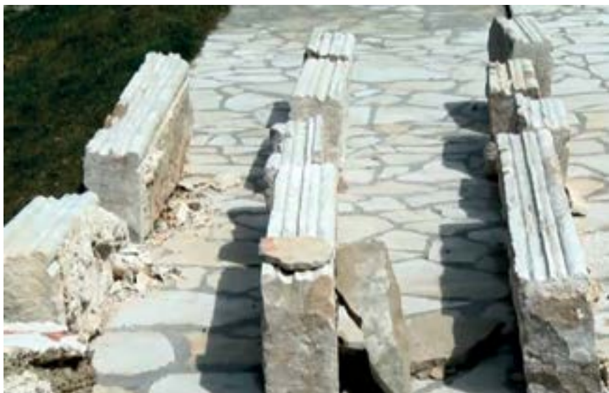
Sl. 3. Ulomci dovratnikâ izvađenih prije istraživanja Fig. 3. Fragments of door-posts pulled out before the excavations