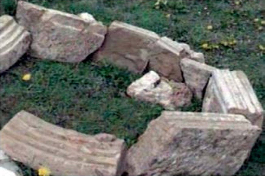
Sl. 4. Ulomci nadvratnikâ i dovratnikâ izvađenih prije arheoloških istraživanja Fig. 4. Fragments of lintels and door-posts pulled out before the archaeological excavations