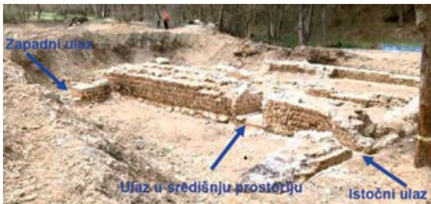
Sl. 10. Ulaz iz sjeverne u srednju prostoriju Fig. 10. Entrance from the north to the central room