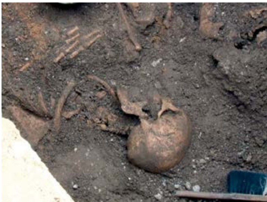
Sl. 18. Skelet odrasle osobe iz sjeverozapadnoga dijela središnje prostorije Fig. 18. Skeleton of an adult from the northwestern part of the central room