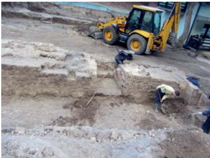
Sl. 11. Otkopavanje zida između sjeverne i srednje prostorije Fig. 11. Excavation of a wall between the north and central room