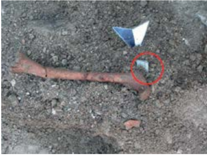
Sl. 19. Bedrena kost sa svitkom olovnog lima iz sjeverozapadnoga dijela srednje prostorije Fig. 19. Femur with a coil of sheet lead from the northwestern part of the central room