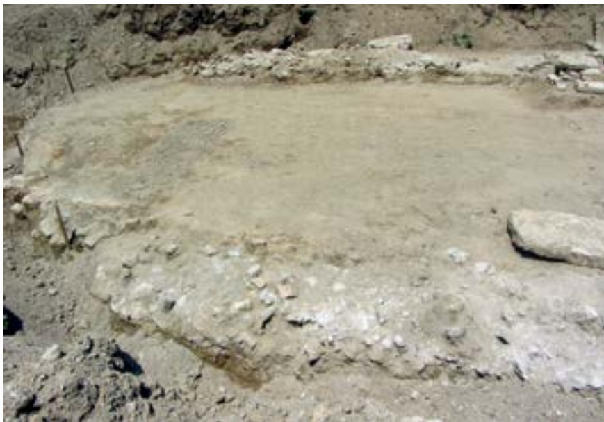
Sl. 14. Tragovi građevine uza zapadnu stranu objekta na Crkvinama Fig. 14. Traces of the object by the west side of the building at Crkvine

Nakon što je vlasnik zemljišta prije druge faze iskopavanja, koja je trajala od 8. do 14. lipnja 2015., bez nadzora uklonio nasip akumulacijskog jezera, uza zapadnu stranu objekta ukazali su se tragovi izdužene građevine (16 x 10 m). Oblik i konstrukcija, ali i okolnosti pojave ne govore u prilog njezinoj autentičnosti (sl. 14), baš kao i manipuliranje srednjovjekovnim nadgrobnicima unutar i oko toga objekta (sl. 15.). Uz južnu stranu sjevernog zida južne prostorije, u nivou ispod temelja, pronađen je ulomak svijetlo-žute keramike (sl. 16) i fragment majolike (sl. 17). U sjevernoj prostoriji zatečeni su tragovi spaljenog krova s desetak kovanih željenih čavala različitih dimenzija. U sjeverozapadnom kutu središnje prostorije naišlo se na ljudski kostur (sl. 18) i bedrenu kost odrasle osobe s omanjim svitkom olovnog lima (sl. 19). Uslijedio je pronalazak dječjih skeleta uza zapadni zid objekta, pohranjenih u običnoj grobnoj raki.