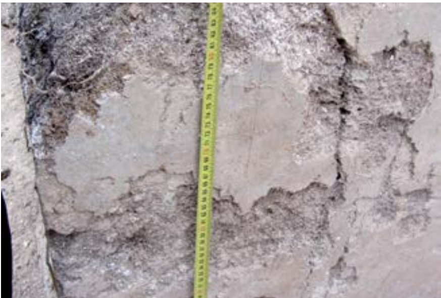
Sl. 9. Urtani pravokutnici na zapadnom dijelu ulaza iz južne u srednju prostoriju Fig. 9. Drawn rectangles on the western side of the entrance from the southern to the central room