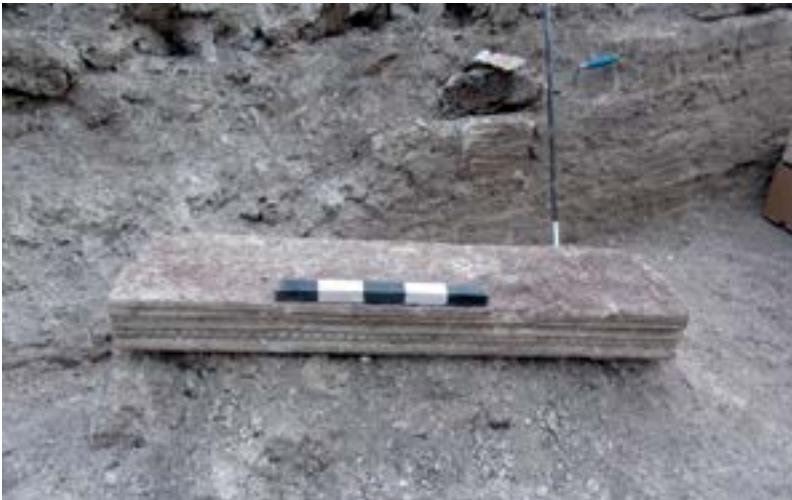
Sl. 1. Dovratnik iz srednje prostorije Fig. 1. Door-post from the central room

zaštita rezultirali su trenutnom propašću najvećeg dijela freski. Nakon uklanjanja nasipa i šteta postalo je jasno da se ovaj objekt (26,8 x 21,40 m) sastojao od tri prostorije različite debljine zidova. U njega se ulazilo kroz dvojna vrata na istočnoj i zapadnoj strani sjeverne prostorije, iz koje se kroz jedna vrata ulazilo u srednju prostoriju (sl. 10). 57 Uklanjanjem nasipa i šteta otkopan je zid između sjeverne i srednje prostorije, za kojeg je utvrđeno da je širok 2, a na nekim mjestima viši i od 2 m (sl. 11). Sjeverni zid kao i istočni i zapadni kutovi sjeverne prostorije u cijelosti su nedostajali. Očito su bili uklonjeni tijekom gradnje akumulacijskog jezera, koje je zahvatilo upravo te dijelove ovoga objekta. Slijedilo je otkopavanje vanjskog zida južne prostorije, čija najveća visina nije prelazila 0,7 m dok mu je širina iznosila oko 1,15 m (sl. 12). Vanjske su mu strane, kao i zida između sjeverne i srednje prostorije, građene od precizno oklesanih sedrenih blokova. Prostor između sedrenih blokova popunjen je lomljenim vapnencem vezanim obilnim količinama vrlo kvalitetnog maltera. Dimenzije ostalih zidova bile su različite kako u širini tako i u visini. Temeljni zidovi ovoga objekta položeni su na lomljeni vapnenac različitih dimenzija. Na zapadnoj strani objekta, uz vanjsku stranu zida koji dijeli srednju i južnu prostoriju, nalazila se grobnica (2,05 x 2,25 m) s ljudskim skeletima (sl. 13).