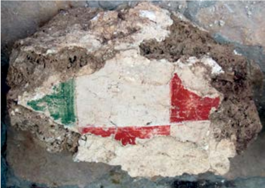
Sl. 8. Ulomak freske s plavozelenim kvadratom Fig. 8. Fragment of the fresco with the blue-green square