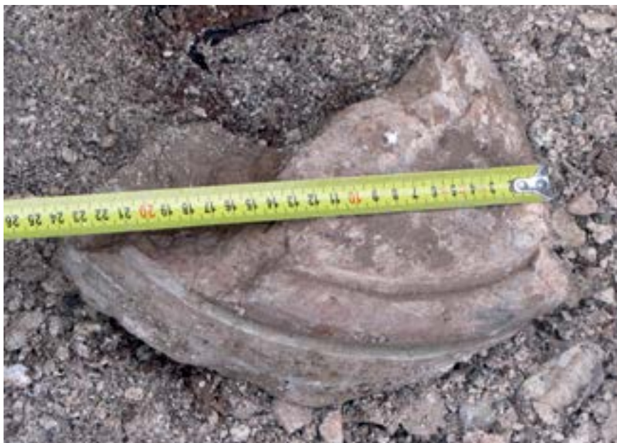
Sl. 6. Ulomak baze stupa Fig. 6. Fragment of a colonnade basis