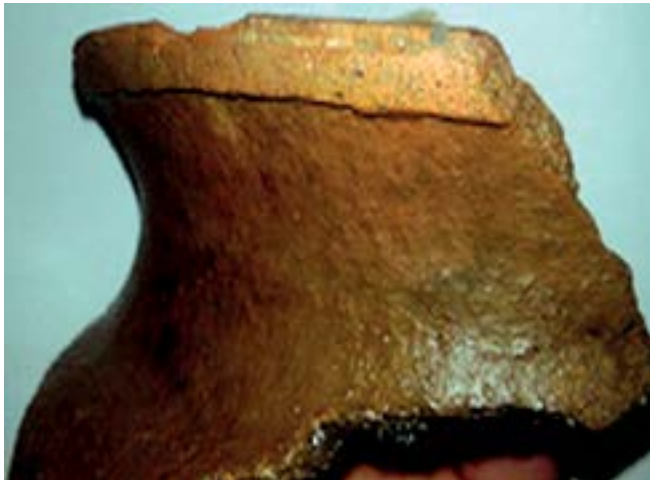
Sl. 16. Ulomak žute keramičke posude Fig. 16. Fragment of yellow ceramic bowl