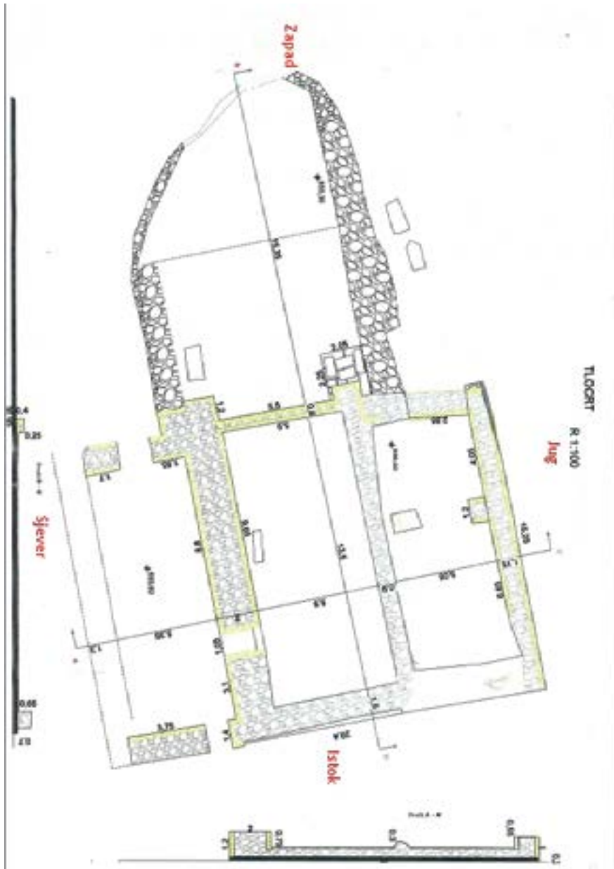
Plan 1. Plan kasnosrednjovjekovnog objekta na Crkvinama u Veseloj kod Bugojna Map 1. Map of the late medieval object on the Crkvine locality in Vesela near Bugojno